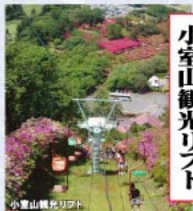
小室山山頂からの風景