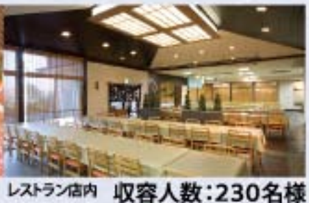
レストラン店内 収容人数：230名様